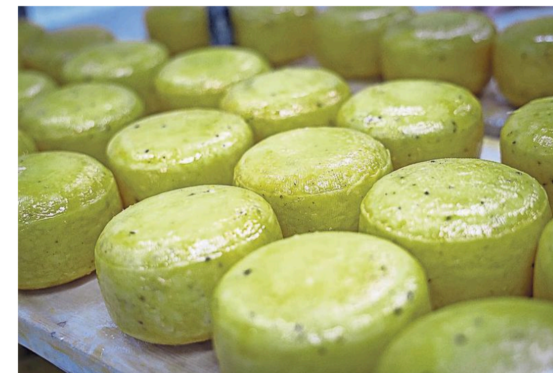
De klanten kunnen kiezen uit ruim vijftien verschillende smaken.

Steeds meer uit hun jasje gegroeid, kon op de plek van de afgebrande kapschuur uiteindelijk een nieuwe kaasmakerij worden neergezet. Die werd in 2019 in gebruik genomen. „We besloten dat eerste jaar te gebruiken om met elkaar goed te leren werken in zo'n grote kaasmakerij”, aldus Marry. „Voor- dat we zouden inzetten op groei, wilden we eerst onze bestaande klanten goed kunnen beleveren. Eind 2019 dachten we: '2020 wordt ons jaar'. Nu gaan we knallen. En toen kwam corona.”